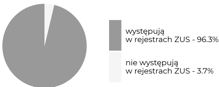
Absolwenci, którzy w okresie objętym badaniem ...