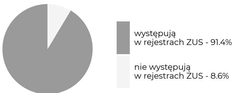
Absolwenci, którzy w okresie objętym badaniem ...